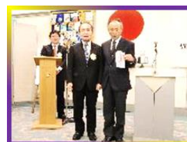
福田会員 喜寿おめでとうございます