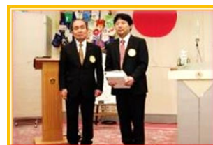
平川 会員 ご入会 おめでとうございます。