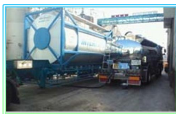
会社案内によると『1992年(平成4年) 尼崎油脂団地組合より共同棧橋を購入』イメージ写真