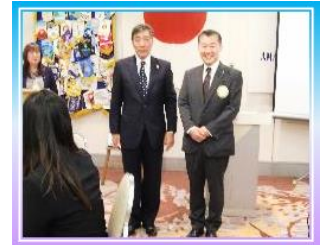
大野さんご入会 おめでとうございます